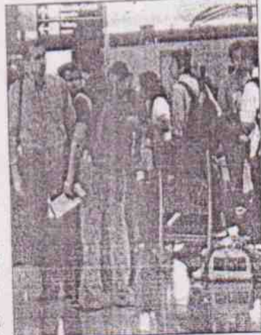
CASCADING EFFECT: Airlines were forced to issue boarding cards manually

Delhi International Airport (P) Ltd (DIAL) officials confirmed that there were no problems with the airport infrastructure but that all MTNL lines were down. Sources